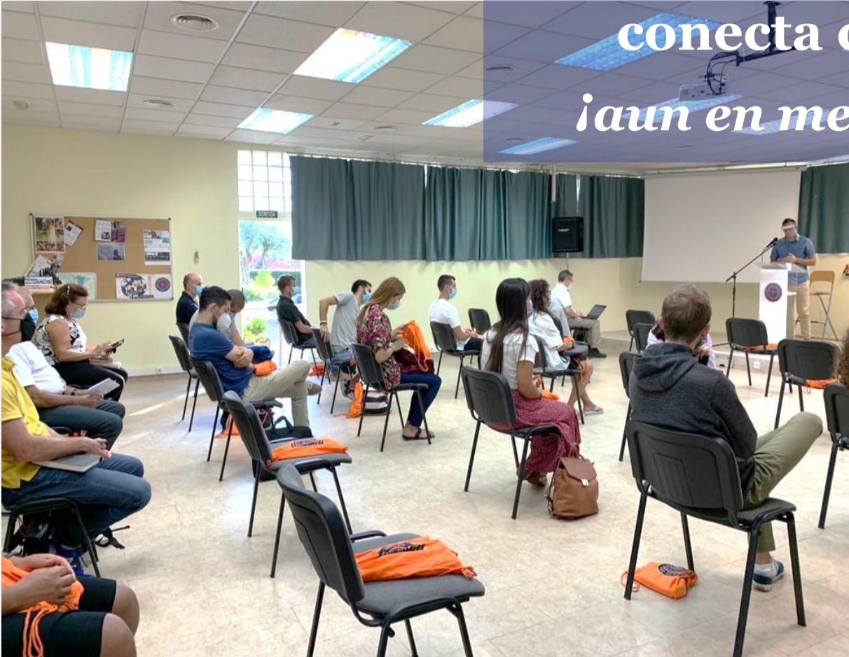
El pasado 14 de septiembre, Día de Orientación

IBSTE: “Donde la Teología conecta con la vida”... ¡aun en medio de la Covid!